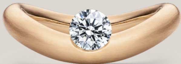
RING LA LUNA / ROSÉGOLD / 1,20CT