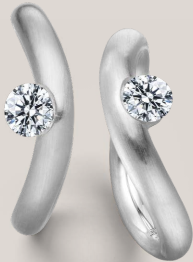
RING LA LUNA / WEISSGOLD / 0,50CT