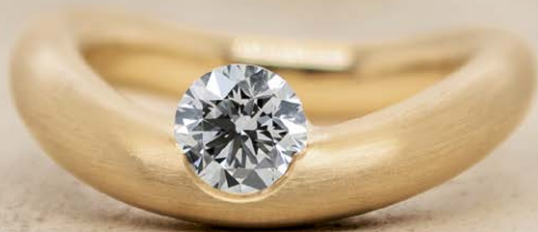
RING LA LUNA / GELBGOLD / 1,00CT