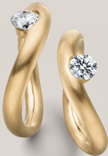
RING LA LUNA / GELBGOLD / 0,50CT